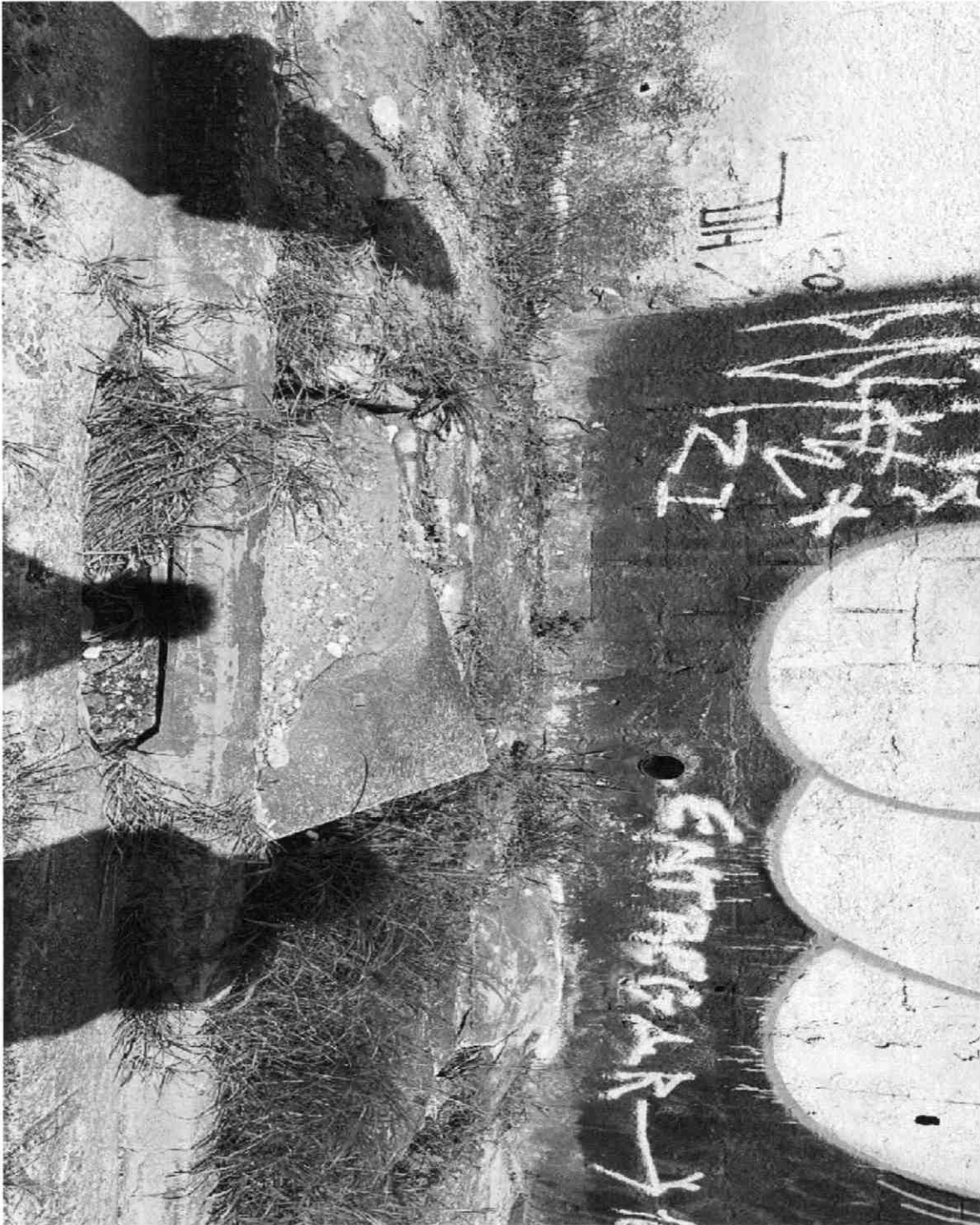
LIMPEZA DE BOCA DE LOBO NA RUA CELESTE AMOROSO MUHLEISE, VILA LAVÍNIA – MOGI DAS CRUZES.